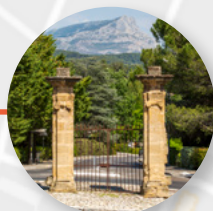
PORTAIL CEZANNE Cézanne's portal