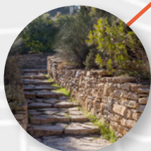
ACCÈS PIÉTONS Pedestrians access